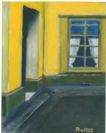
Impasse parisien, 28 x 22 cm