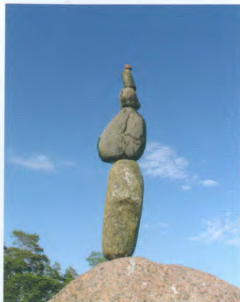
Le grand Sâge, Pihlajasaari, H 110 cm